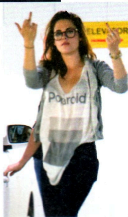
El festival de Coachella fue uno de los escenarios en los que se vio a Kristen y Robert como pareja. Tras la ruptura, Kristen no dudaba en enfrentarse a los fotógrafos que la seguían.