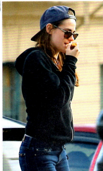
Triste tras la separación, durante mayo y junio se apoyó en sus amigos para superar, lejos de los medios, el fin de su relación.